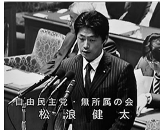
▲NHKの中継画像より=4月13日

結果、関東財務局は同社に対して警告書を出すとともに、警察庁への情報提供を始めた。